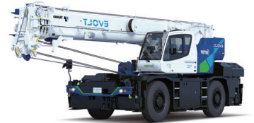
7FL電動ラフテレーンクレーン EVOLT eGR-250N

ラフテレーンクレーンを使ったゲームを作ってみよう。クレーンの仕組みと動作を理解すれば、うまく操作できるよ。