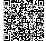
問い合わせフォーム