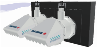
全速全水位型横軸水中ポンプ フラッドバスター