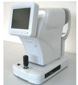
アイケア機器：検眼機 標準型オートレフケラトメーター